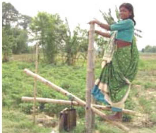
'n Vrou hanteer 'n bamboes trappomp in Nepal.

In lande wat erg geraak word deur droogte, soos Zambië, is dit belangrik dat mense in staat is om die hele jaar voedsel te kan produseer. Om dit te doen het hulle tegnologie bekendgestel om die beste gebruik te maak van beskikbare waterbronne. 'n Baie eenvoudige en goedkoop waterhystoestel wat daar gebruik word is die trappomp. Dit het miljoene van die wêreld se armste boere in ontwikkelende lande hul inkomste laat verdubbel. Deur hierdie toestel te gebruik, is boere in hierdie lande in staat om 'n tweede of selfs 'n derde oes in die droë seisoen te oes sowel as om nuwe variëteite van groente te plant. In sommige gevalle, groei gesaaides waar niks ooit vantevore gegroei het nie.